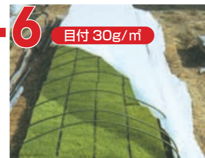
露地・トンネルがけ