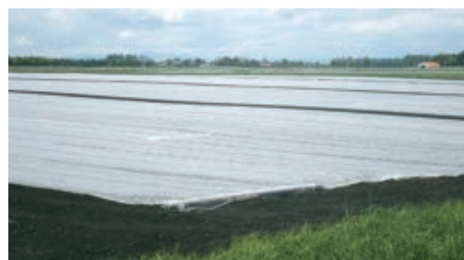
ニンジン：ほ場全面へのべたがけ使用例