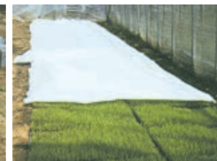
ハウス内べたがけ