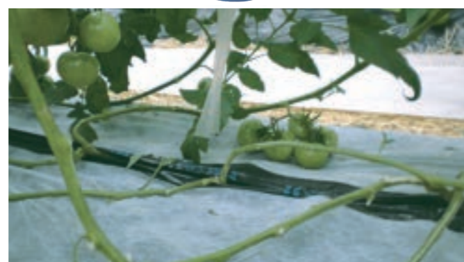
トマト：果実品質向上につなげるマルチ上への使用例