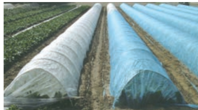
ホウレンソウ：トンネルがけ使用例、右は青パオパオを使用