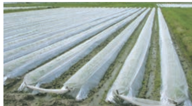
タバコ：マルチと組み合わせたべたがけ使用例