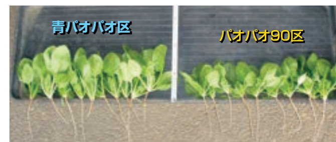
播種：2004年3月24日 品種：ホウレンソウ「アクティブ」 撮影：2004年4月30日 場所：千葉県成田市